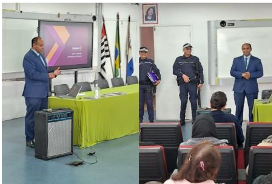
Figura 4 – Apresentação do Encontro com Eles

Dessa forma, o Programa “Encontro com Eles” (Figura 4) consolidou-se como uma prática extensionista inovadora, integrando educação, equidade de gênero e sustentabilidade social, reafirmando o papel do município de Mauá como território comprometido com os direitos humanos e a Agenda 2030.