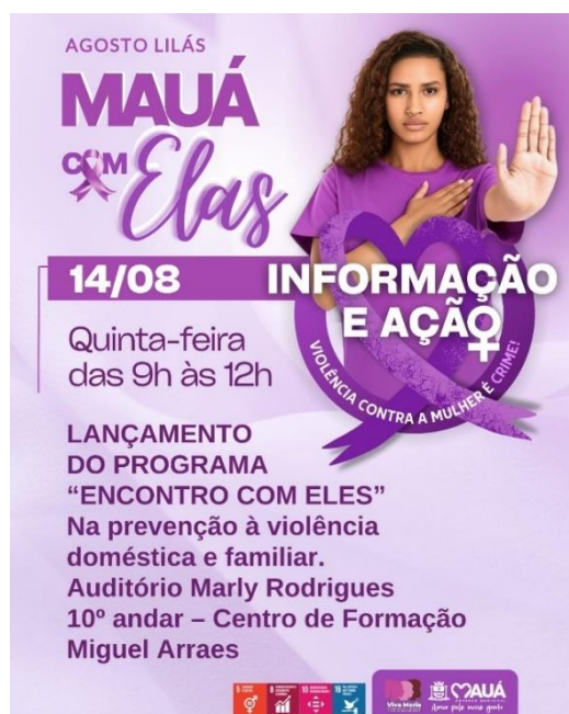
Figura 3 – Convite para o Encontro com Eles